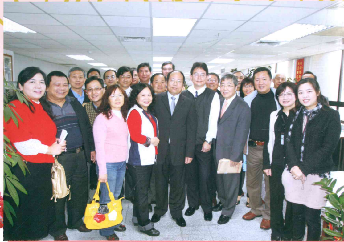
99.02.23 本會理監事拜會桃園縣政府地政處