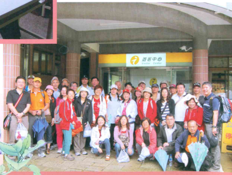
99.05.14本會理監事暨主.副主委.委員聯誼會