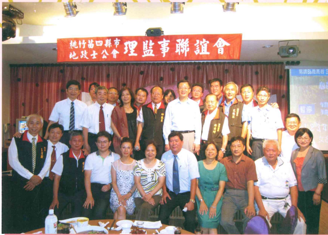
99.09.02桃竹竹苗四縣市理監事聯誼會